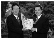
2008年11月6日, 马英九 会见陈云林