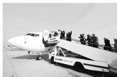
2008年12月15日两岸 “三通”正式启动

(1) 材料一中邓小平提出“一国两制”构想的目的是什么? (4分) 20世纪90年代, “一国两制”有何体现? (3分)